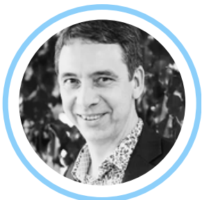
Xavier MARIE Sol Paysage