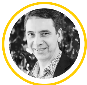
Xavier MARIE Sol Paysage